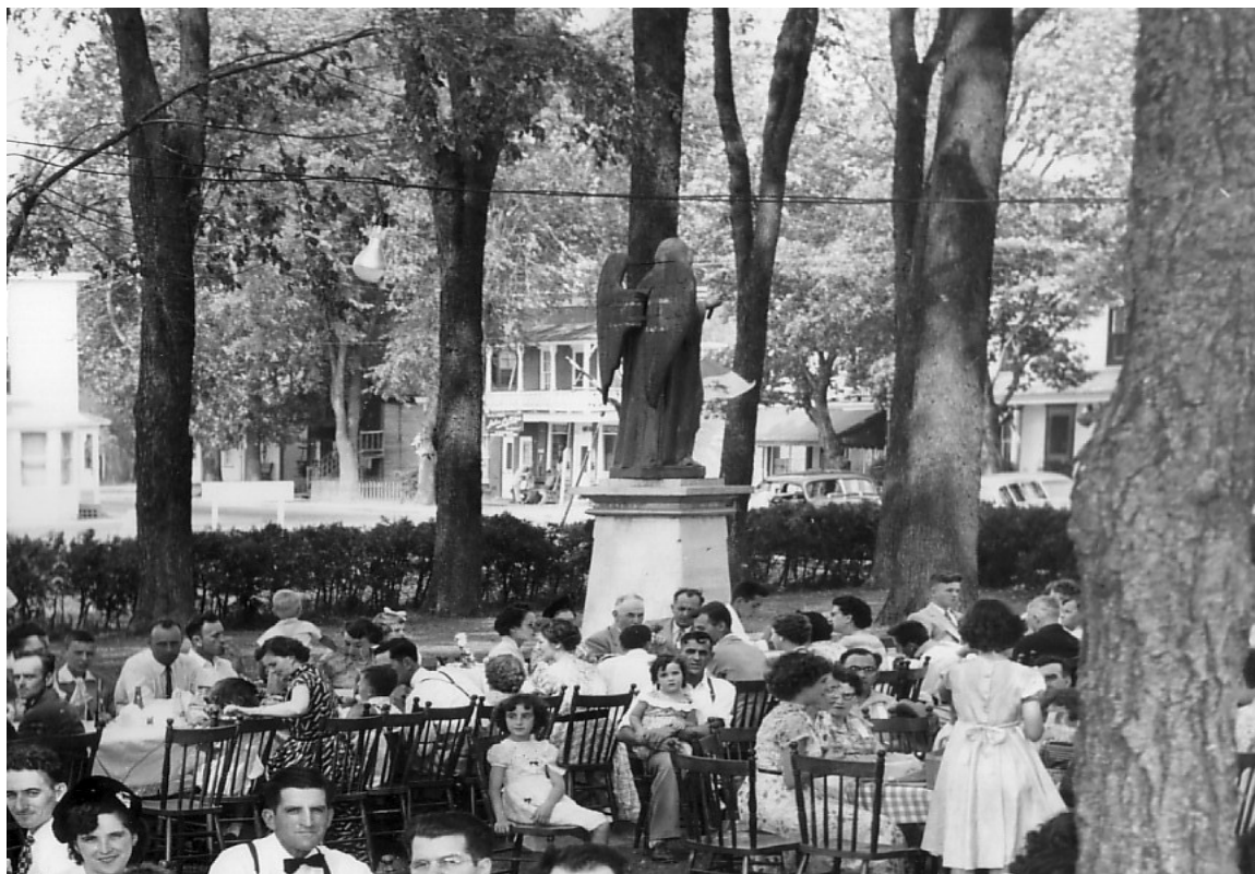
La statue de l'Ange Gardien devant l'église lors d'un rassemblement des paroissiens en 1953 (4)

Cette démarche fut très fructueuse. Un document de Mgr Desmarais vient confirmer la bénédiction d'une statue d'un ange à Canrobert, sur la place en face de l'église. 8- Par contre, absolument aucun renseignement en rapport avec cet événement dans le journal de Saint-Hyacinthe. 9- Donc nous ne savons pas si ce sont les paroissiens ou un mécène, qui ont payés pour la statue?